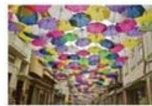
↑「アンブレラ・スカイ・プロジェクト」の様子